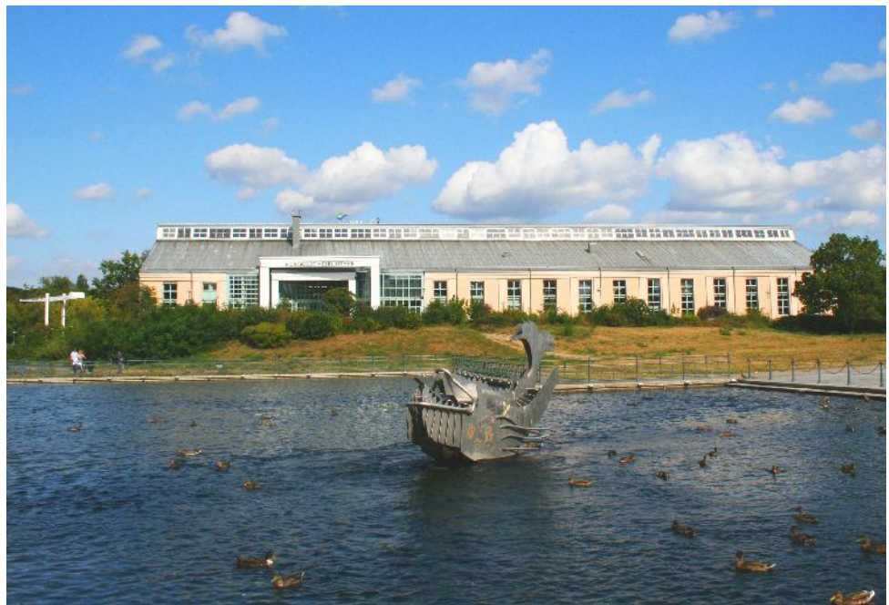
Humboldt - Bibliothek ( Tegel )